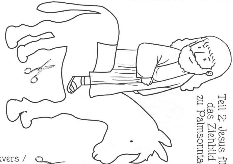
Teil 2: Jesus für das Ziehbild zu Palmsonntag