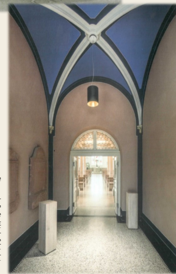
Eingang der Ev. Stadtkirche Schriesheim