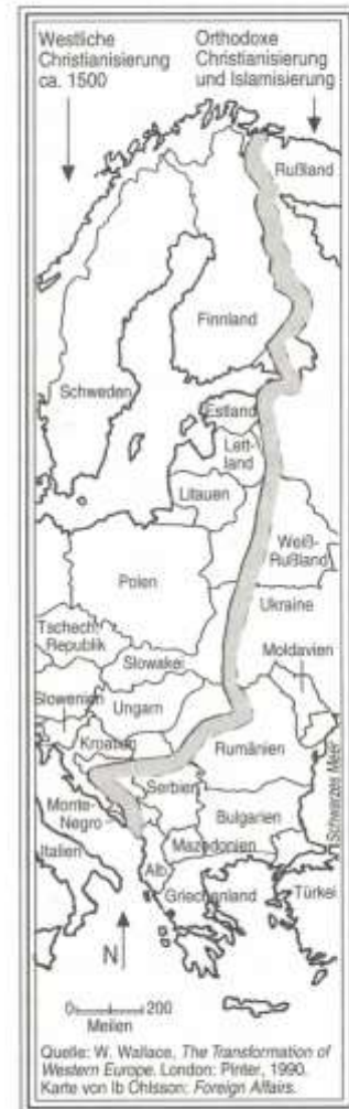
Karte 7.1 Die Ostgrenze der westlichen Zivilisation