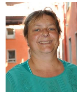
Bettina Drexler Bibliothek, Medi@thek