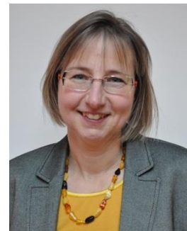
Sabine Köhrer-Weisser Bibliothek, Medi@thek