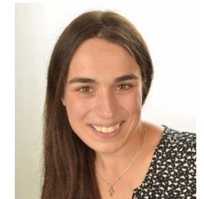
Christine Schneider Grundschulen